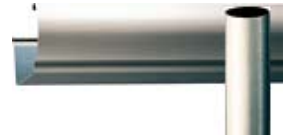
ヘアライン クリアーグレイ (受注生産)