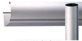
ヘアラインクリアー