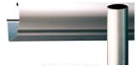
ヘアライン クリアーグレイ (受注生産)