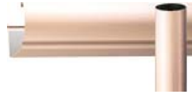
ヘアライン クリアーブロンズ (受注生産)