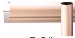
ヘアライン クリアーブロンズ (受注生産)