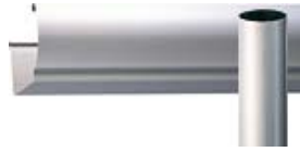
ヘアラインクリアー