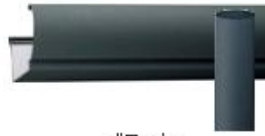
ブラック (受注生産)