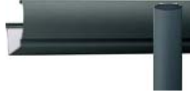
ブラック (受注生産)